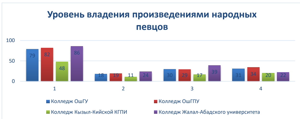
Диаграмма 2.2.1. –уровень владения произведениями народных певцов (число)

Как видно из таблицы, например, в опросе приняли участие 79 студентов колледжа ОшГУ, из них 18 студентов имели высокий уровень усвоения, 30 студентов – средний уровень и 31 студент показали низкий уровень владения материалом. (смотрите другие колледжи)